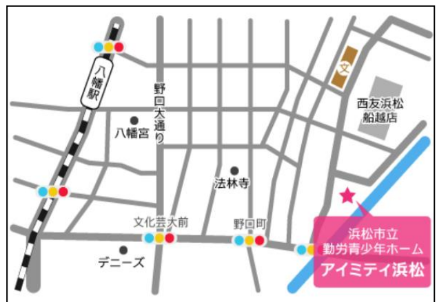
「訓練実施会場」案内図